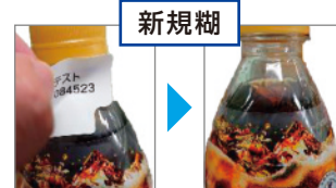
糊がまったく残らない

新しく開発した キャンペーンタックラベル。 手で剥がしても 糊が残らないように改良。